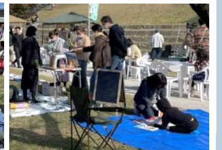
青空の下、ブース横のスペースで絵本を 親子で楽しむ姿も。